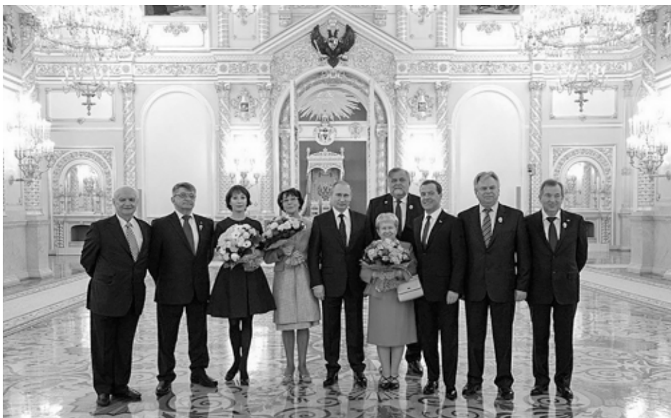
На церемонии вручения Государственных премий Российской Федерации за 2014 год, июнь 2015 г.