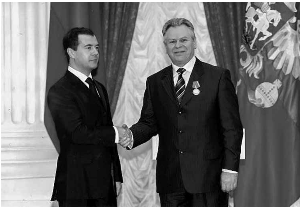
Встреча с президентом Д.А. Медведевым на церемонии награждения Орденом Почёта, 2009 г.

Известный писатель, претендовавший быть совестью русской нации, забыв о высокой оценке, данной им раньше чеченцам, призвал загнать всех чеченцев России в резервацию и обнести их «колючей проволокой».