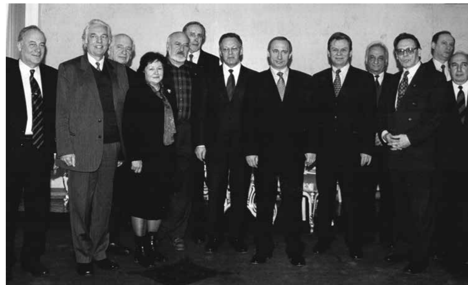
Встреча в Президиуме РАН с президентом В.В. Путиным по обсуждению конфликта в Чечне, февраль 2000 г.