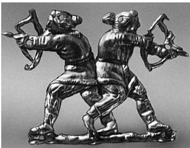
Скифы. Бляшка с изображением скифов, охотящихся с луками. Золото. VII-II вв. до н. э. Эрмитаж. С-Пб.