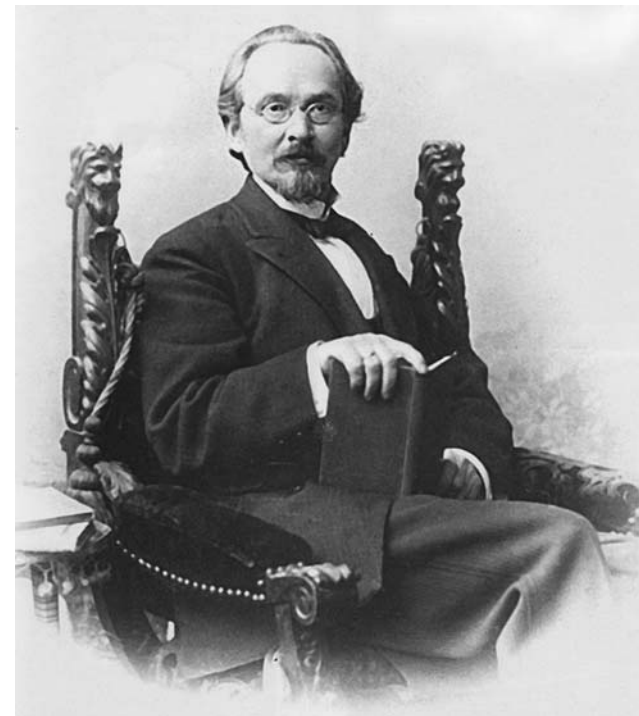
В.В. Розанов (1856-1919)

Впрочем, это как раз и неудивительно, так как расчленители общества, разрушители России прекрасно знают, кому петь осанну, а кого оставить в тени. В.В. Розанову поют осанну. Чёрный пиарщик толкает того, кто работает на разрушение сознания; того же, кто своим творчеством способствует созиданию и сплочению общества – он всеми силами пытается замолчать и не дать ему ходу. И напрасно Д. Галковский, автор статьи «Счастливый Розанов» (Литературная газета, № 16 (6067), 19-25 апреля 2006 г.) говорит: «И вот в 90-е годы «юродивый» Розанов ЗАДАВИЛ ВСЕХ. Его книги стали выходить для философа просто-таки гигантскими тиражами, тиражами совершенно коммерческими. Розанова узнали, Розанова полюбили, Розановым увлеклись не сотни московских интеллектуалов, а широкие читающие массы» (1). Неужели г-н Галковский не знает, как это просто делается? И что у такой славы есть своя технология? И что «широкие читающие массы» никогда бы не узнали В.В. Розанова, не будь в него вложены немалые деньги с точным расчётом получить ещё большие деньги, и не будь ему обеспечены: 1) приличные тиражи; 2) реклама имени. Не зря же он сам говорит – «тиражи коммерческие». Но чтобы скрыть это знание, он наивно восклицает: «Причём,