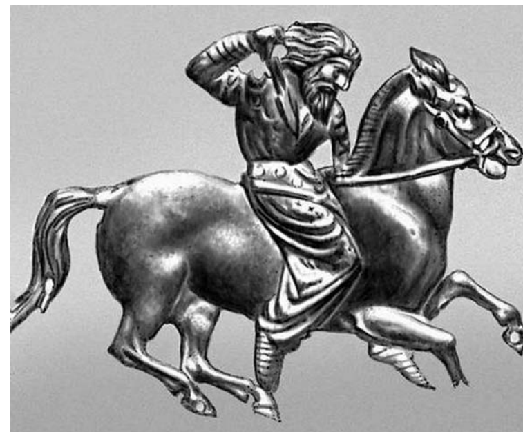
Скифы. Бляшка с изображением скифа, охотящегося на зайца. Золото. VII-II вв. до н. э. Эрмитаж. С-Пб.

Перейдём к следующему важному фактору, который должен окончательно закрыть вопрос об ираноязычности скифов, сарматов и родственных им племён. По данным Миллера, основные находки предполагаемых скифо-сарматских имён приходятся на города Танаид, Ольвию и Пантикапей. Причём