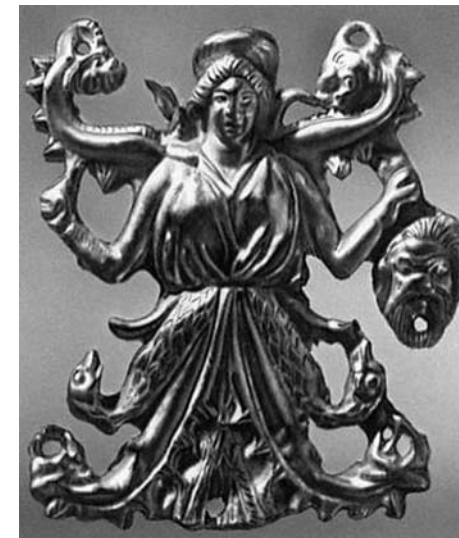
Скифы. Бляшка. Золото. VII-II вв. до н. э. Эрмитаж. С-Пб.

Геродот, рассказывая о скифах, писал, что «на каждом таком холме водружён древний железный меч... Этому-то мечу ежегодно приносят в жертву коней и рогатый скот» (5, IV, 62). Такое же поклонение мечу было и у славян. Одежда скифов и их внешний облик по изображениям, дошедшим до нас,